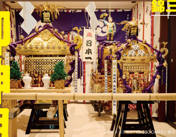
アラスカコーヒー HASSO CAFEに展示

昭和八年に作られた御神輿。一般的な御神輿の屋根は、黒い漆や梨地で仕上げられるのに対し、錦三神輿は本の街という歴史を踏まえて、和木が虫に喰われたような「虫喰い塗り」を採用。さらに、平成八年の大修繕の際には、金箔を髹沢に使用し「金虫喰塗」と昇華。この御神輿は、戦時中、先人達が栃木まで疎開させてまで守り抜いたという逸話も。