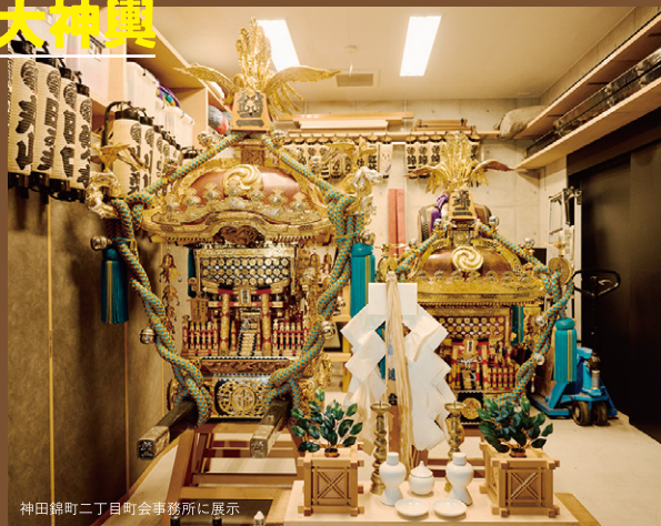
神田錦町二丁目町会事務所に展示

昭和三十三年に作られた御神輿。御神輿の土台となる白輪は珍しい二段構え。一般的な御神輿にはない規格外のサイズで、背が高くスタイリッシュな出立ちが印象的。腕手には銀の巻籠が美しく、網がけされた鮮やかな青色の飾紐がよく映えます。