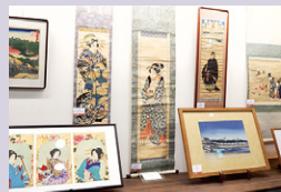
山田書店 Yamada Shoten

東京都千代田区神田錦町 2-3-10 TEL 03-3518-2212 kandanishiki-kisaragi.jp 月~土 17:00-22:00 / 日祝 定休