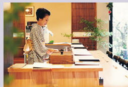
神田錦町 如月 Kanda Nishiki-cho Kisaragi